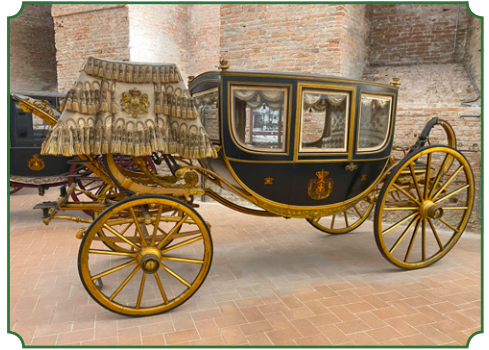
△ Berlin Carriage, C. Sala, 1879, Dep. Quirinal Galleries