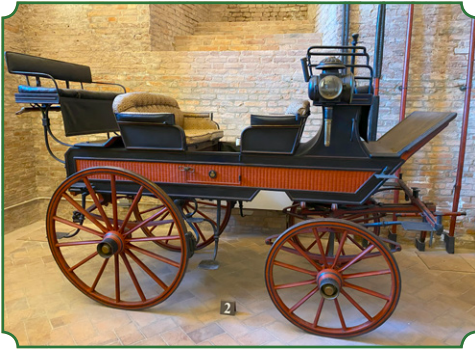
△ Break de chasse, Cesare Sala, Milano 1880