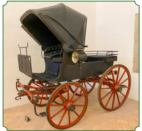
△ Phaeton siamese, Fratelli Baroni, Milano 1880