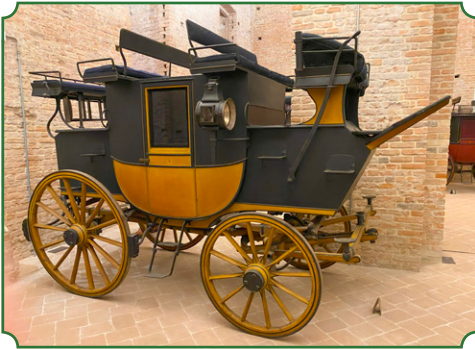
△ Mail-Coach, 1870–1880, Holland & Holland (GB)