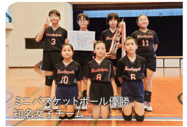
ミニバスケットボール優勝 知名女子チーム