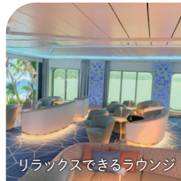
リラックスできるラウンジ