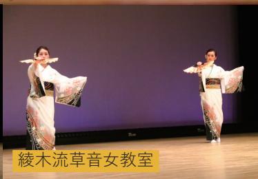
綾木流草音女教室