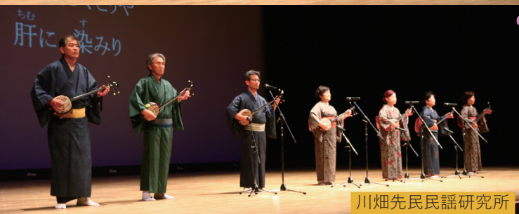
川畑先民謡研究所