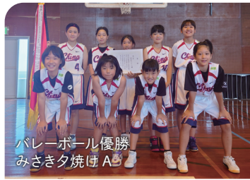
バレーボール優勝 みさき夕焼けA