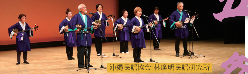
沖縄民謡協会 林廣明民謡研究所