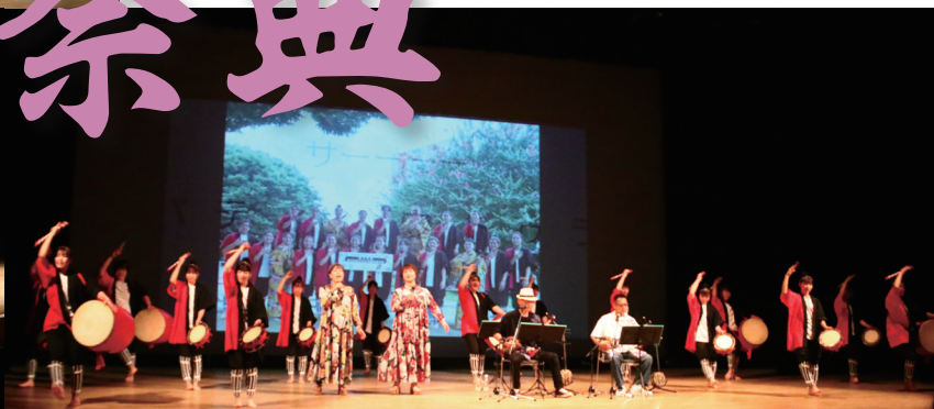
エイサー部と遊弦会せりよさのコラボ