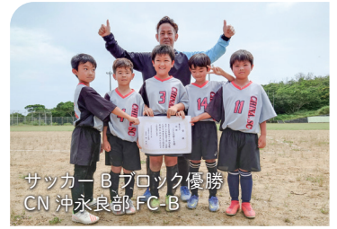
サッカーBブロック優勝 CN 沖永良部FC-B