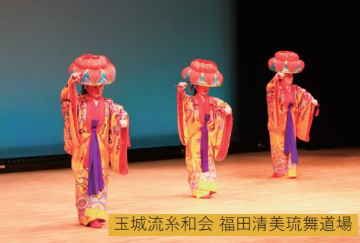
玉城流糸和会 福田清美琉舞道場