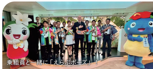
乗組員と一緒に「えらぶポーズ」!