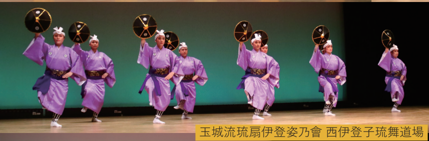
玉城流琉扇伊登姿乃會 西伊登子琉舞道場