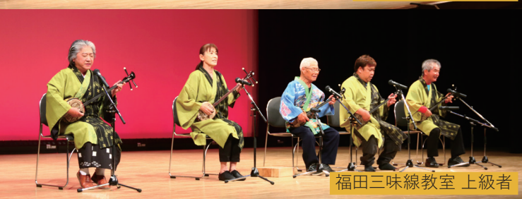
福田三味線教室 上級者