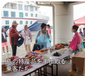
島の特産品を手にする乗客たち