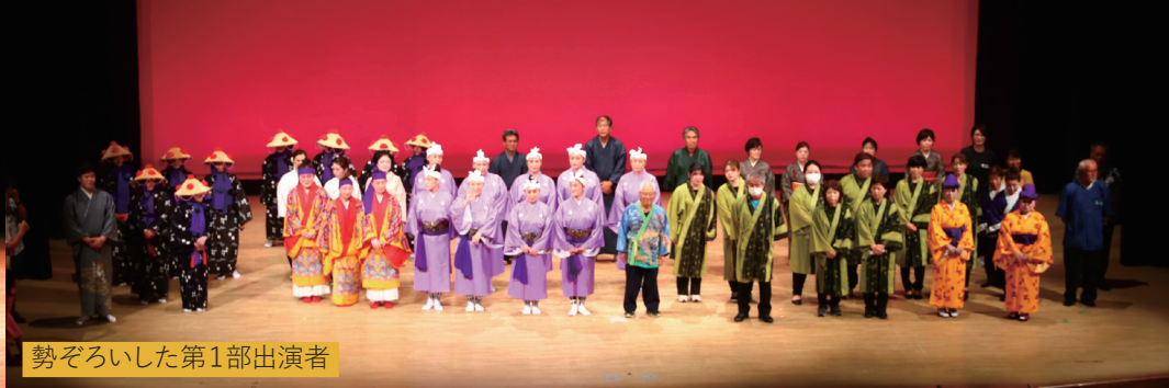
勢ぞろいした第1部出演者