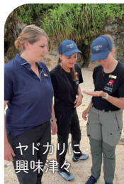
ヤドカリに興味津々