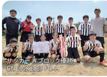
サッカーAブロック優勝 CN 沖永良部FC-A

5月21日、町総合グラウンドにて第41回サッカー大会が開催されました。結果▶【Aブロック】1位：CN 沖永良部FC-A / 2位：みさき夕焼けA / 3位：下平川A【Bブロック】1位：CN 沖永良部FC-B / 2位：CN 沖永良部FC-C / 3位：みさき夕焼けC。また、同日に町民体育館で開催された第42回バレーボール大会には5チームが参加しました。結果▶【1位】みさき夕焼けA【2位】西目。なお、6月4日には第43回ミニバスケットボール大会が開催され、4チームが参加しました。結果▶【1位】知名女子【2位】知名混合【3位】下平川混合。