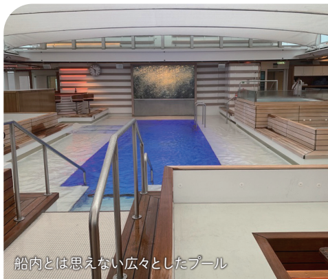
船内とは思えない広々としたプール