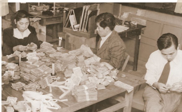
▲琉球銀行で仕分けされるB円

令和5年は、奄美群島が日本に復帰して70年の節目の年です。今回は、当時の通貨を写真で紹介いたします。 第2次世界大戦末期まで、奄美群島・沖縄は本土地域と同じく日本円の通貨（紙幣・硬貨）が用いられていました。しかし、米軍占領下となって以降は世界的にも例のない27年間に5回もの頻度で通貨切り替えと通貨制度の変更が行われました。 当時の代表的な通貨としてB円があります。これは、アメリカが使用する軍票の1種であり、1日本円＝1B円の単位として全て紙幣 で構成されていきました。その後、アメリカドルに通貨交換が行われましたが、日本復帰に伴い法定通貨が現在の日本円となりました。