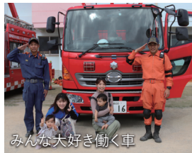
みんな大好き動く車