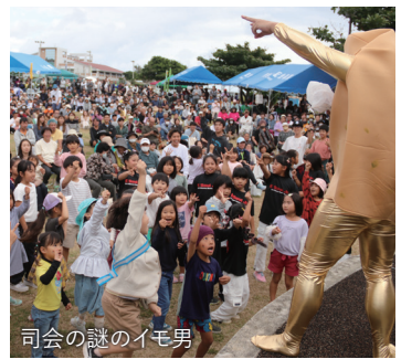
司会の謎のイモ男