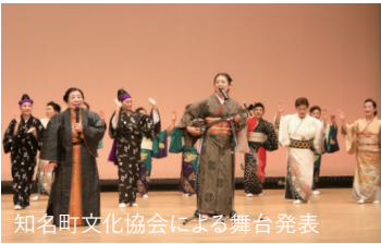
知名町文化協会による舞台発表