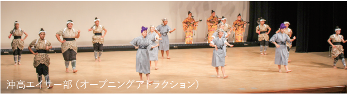
沖高エイサー部 (オープニングアトラクション)

びの郷・ちなでは、4日に知名町文化協会による前夜祭、5日は式典、公民館講座舞台発表が行われ、11月10日までは町内保育園、子ども園、小中学生の児童生徒による作品や高校生の書道作品など、素晴らしい作品が展示されました。