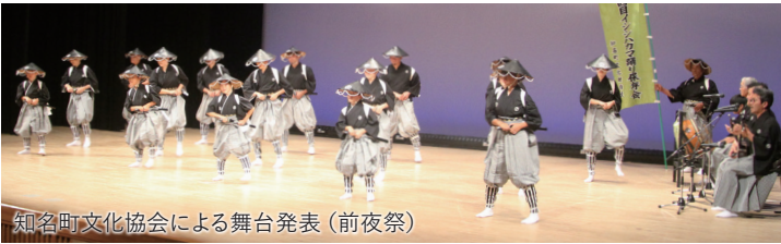
知名町文化協会による舞台発表 (前夜祭)