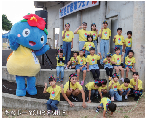
ちなポー YOUR SMILE