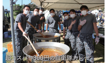
超ユスバ！300円の自衛隊カレー