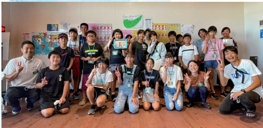
2年目 「イングリッシュグリーンキャンプ」

りました。今後とも知名町の教育魅力化に向けて、一般社団法人えらぶ手帖としてえらぶゆりの島留学のサポート、oLab（みんなのおうち）や町主催のイングリッシュグリーンキャンプの探究プログラムの開発等を行ってまいりますので、改めて今後ともよろしく願います。