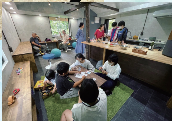
〈みんなのおうち〉 アトリエ