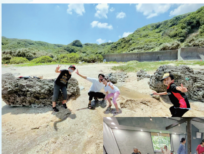
2年目 「えらぶゆりの島留学」1期生